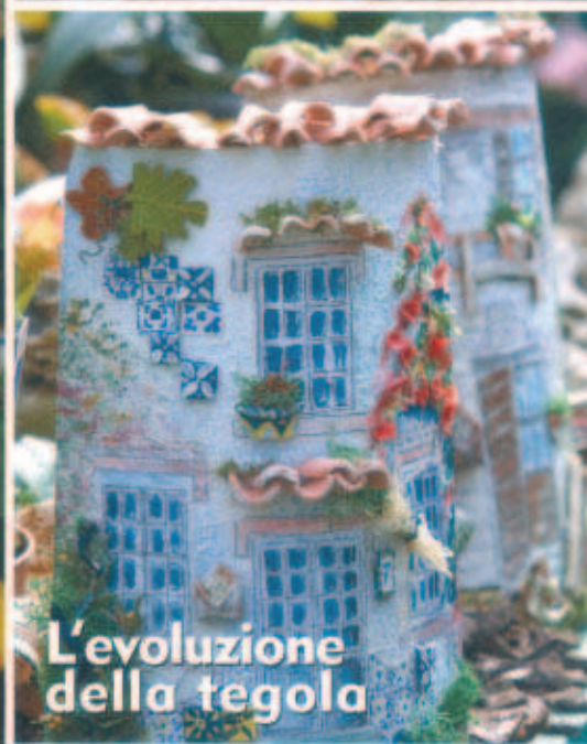
L'evoluzione della tegola

ADD ARTE DEL DECORARE N. 29 - ANNO 6 - BIMESTRALE - EDIZIONI LUMINA - DISTRIBUTORE PER L'ITALIA: PRESS-DI DISTRIBUZIONE STAMPA E MULTIMEDIA S.R.L. - 20090 SEGRATE (MI) FRS 10.50 - POSTE ITALIANE SPA - SPED. IN A.P. - D.L. 3553/2003 (CONV. IN L. 27/02/2004 N. 46) ART. 1 COMMA 1, DDB 011/140